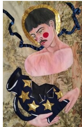
Denys Shantar Der zerbrochne Krug, 2022-25