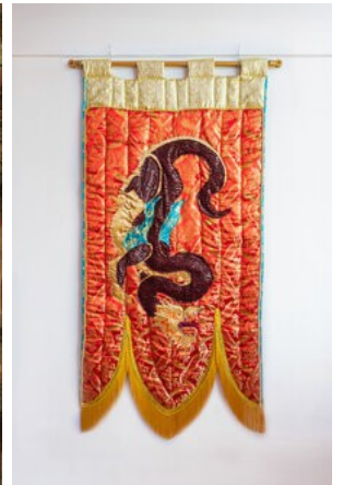
Hemaseh Manawi Rad To focus, 2025, voorzijde