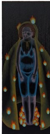
Anne Silverstrand Forest Halagrian World, 2024